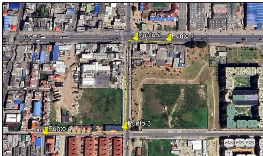
Ilustración 1. Recorrido

Se realizó recorrido de control y vigilancia en el cuadrante 2, barrios Serrezuelita y Nueva Gerona el día 12 de junio del 2024, desde las coordenadas 4°42'49.045"N-74°12'30.769"W hasta las coordenadas 4°42'39.481"N- 74°12'34.345"W (ver ilustración 1. Ruta amarilla), con el fin de verificar las condiciones ambientales, identificar posibles afectaciones a los recursos naturales y realizar las acciones de prevención correspondientes.